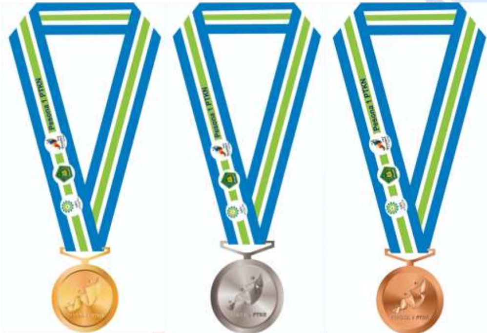
Gambar 1. Design Medali