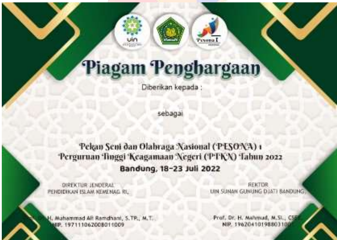
Gambar 2. Design Piagam Penghargaan